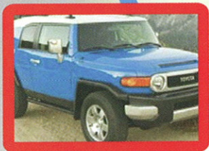
Location des véhicules