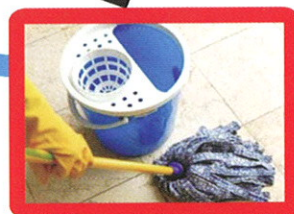
Entretien & Ménage