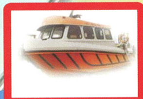
Location Bateau Surfer