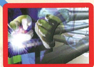
Maintenance Industrielle On/Offshore